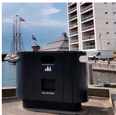
Fjordpark Miljø 3x105L