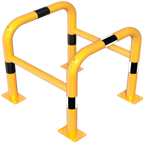
Påkjøringsbeskyttelse galvanisert 4 ben m/ fotplate 600mm/600mm/650mm Prod.nr.: 51520200110