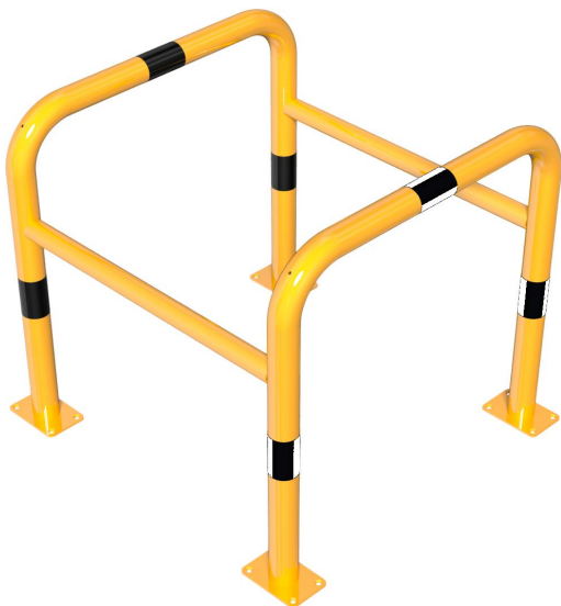
Påkjøringsbeskyttelse galvanisert 4 ben m/ fotplate 800x800x800mm Prod.nr.: 51520200100